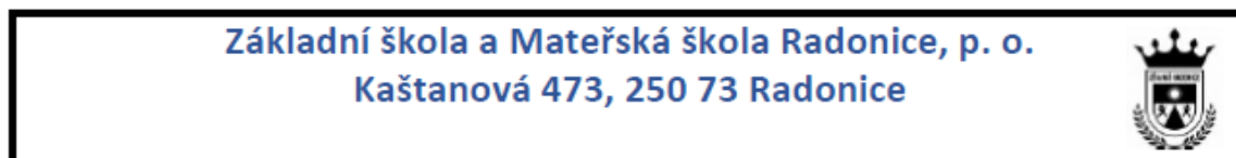
Schéma školního poradenského pracoviště – školní rok 2023/2024

občanků, Halloween, karneval, Mikuláš ve škole, vánoční besídky, Vítání prázdnin, Zahradní slavnost a další sportovní a kulturní akce.